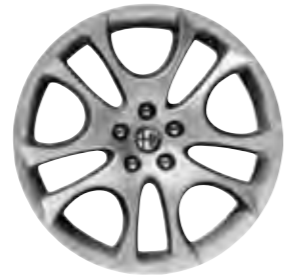
Leichtmetallräder „Supersport II“ 7J x 17" mit Bereifung 215/45 (Option 421).