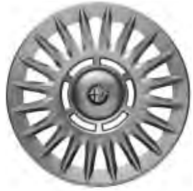
Stahlräder mit Radvollabdeckung, 6J x 15" mit Bereifung 185/65.