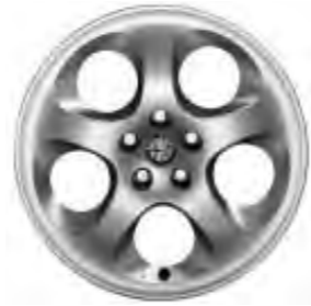
Leichtmetallräder „Sport“ 6,5J x 16" mit Bereifung 205/55 (Option 55E).