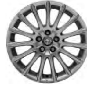
Leichtmetallräder „Sportspeiche“ 6,5J x 16" mit Bereifung 205/55 (Option 435).