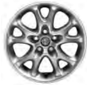
Leichtmetallräder „Elegant“ 6,5J x 15" mit Bereifung 195/60 (Option 431).