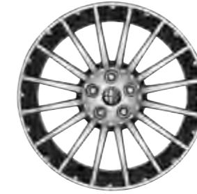
Leichtmetallräder „Sportspeiche II“, 7J x 17" mit Bereifung 215/45 (Option 420).