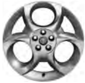
Leichtmetallräder „Supersport“ 7J x 17" mit Bereifung 215/45 (Option 439).