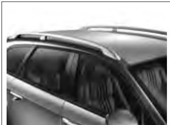
Dachreling in Aluminiumdesign (nur für Sportwagon)