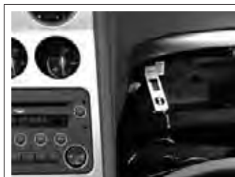
Blue & Me™, Bluetooth® Funk-Freisprecheinrichtung mit USB-Anschluss im Handschuhfach