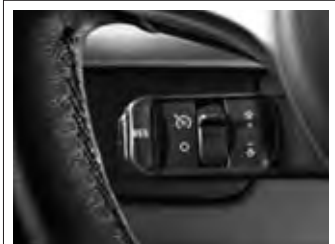
Cruise Control (automatische Fahrgeschwindigkeitsregelung)