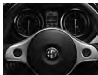
Multifunktionstasten für Radio- und Telefonbedienung am Lenkrad