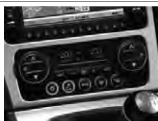
Dual-Zonen-Klimaautomatik, getrennt regelbar mit Pollen- und Aktivkohle-Filter, Belüftungsdüse im Fond