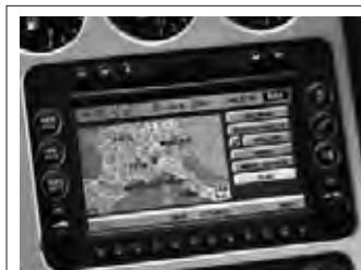
Navigationsystem mit Kartendarstellung und GSM-Telefon, Audioanlage mit CD-Laufwerk