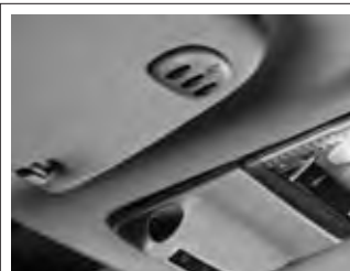
Homelink, zur Fernsteuerung von bis zu 3 Garagentoren