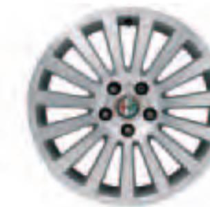
Leichtmetallräder „Elegant I“ 7,5J x 17" mit Bereifung 225/50 (Option 433)