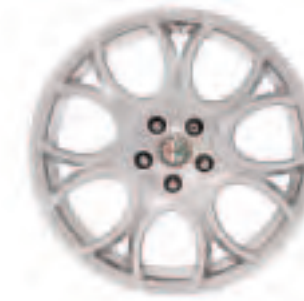
Leichtmetallräder „Sportclassic“ 8J x 18" mit Bereifung 235/45 (Option 421)