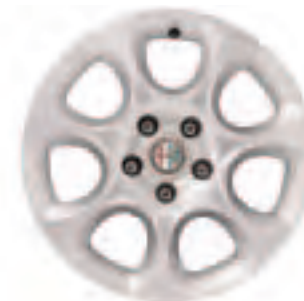
Leichtmetallräder „Elegant“ 7J x 16" mit Bereifung 215/55 (Option 431)