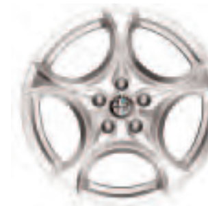
Leichtmetallräder „Sport I“ 7,5J x 17" mit Bereifung 225/50 (Option 432)