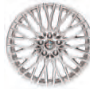
Leichtmetallräder „Supersport I“ 8J x 18" mit Bereifung 235/45 (Option 439)